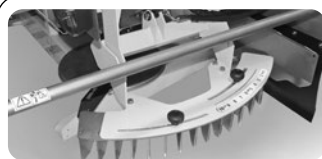
Limiteur mobile bord droit de l'épandeur.