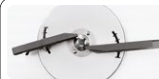
Kit pour épandage