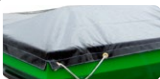
Bâche pour épandeur FRT.