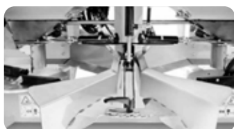
Limiteur central acier inox épandeur